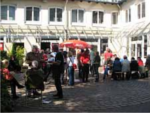
Foto: Frühjahrsempfang 1.5.